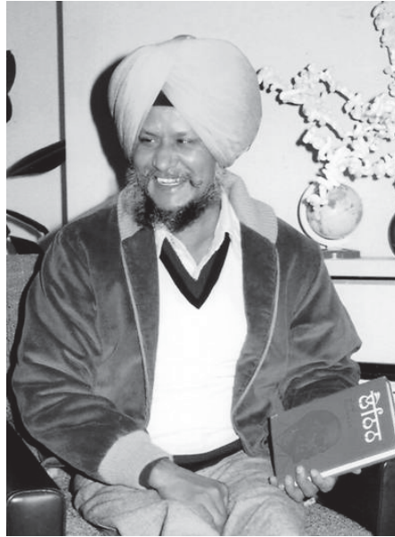
(ਸੰਤ ਰਾਮ ਉਦਾਸੀ, ਸੰਨ 1979 ਵਿੱਚ ਕਾਵੈਂਟਰੀ ਇੰਗਲੈਂਡ)