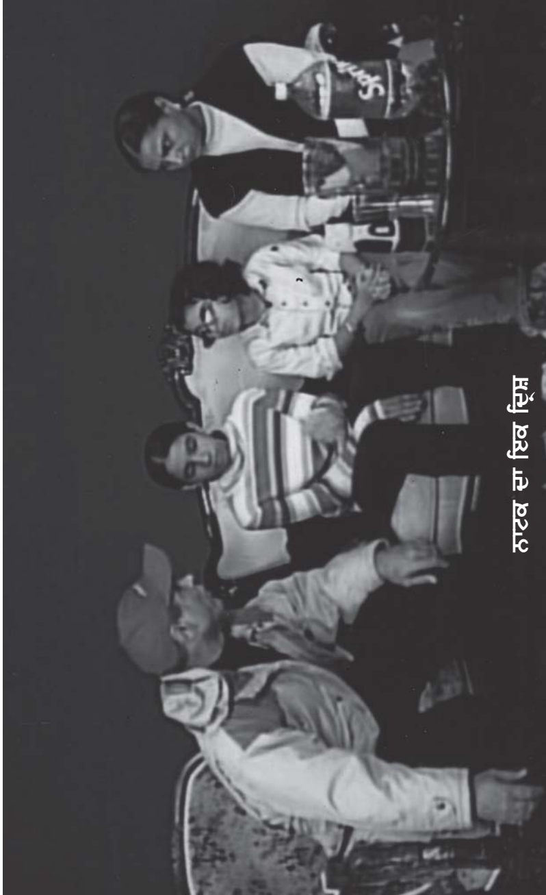
ਭਾਲਰਾਂ ਦੀ ਦੌੜ/54