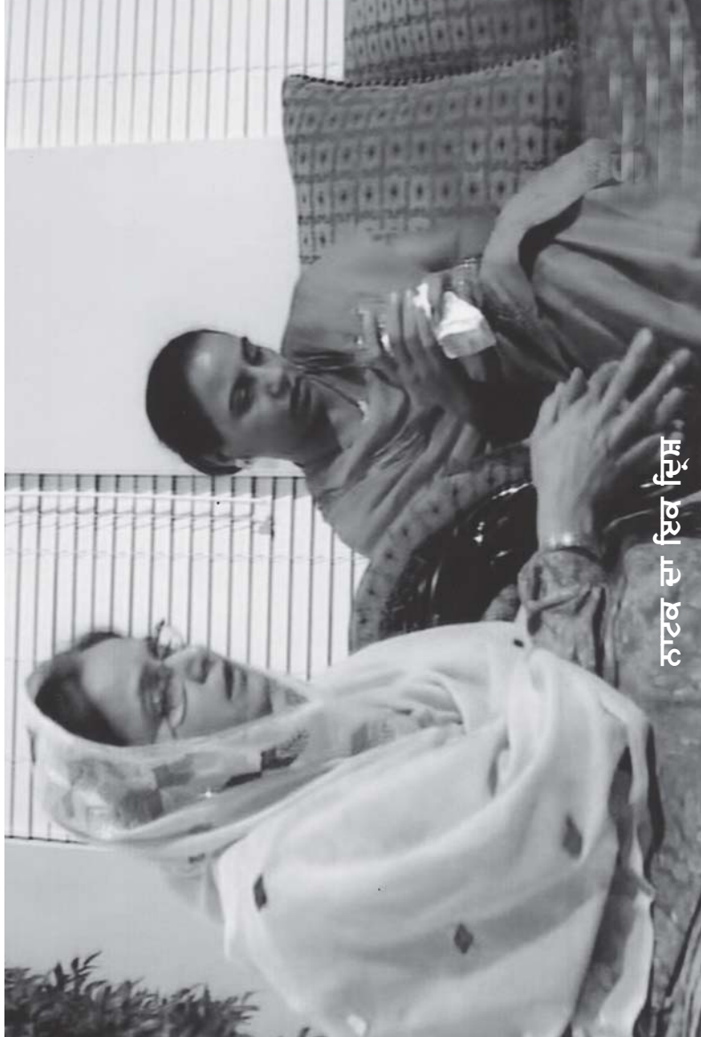
ਭਾਲਰਾਂ ਦੀ ਦੋੜ/66