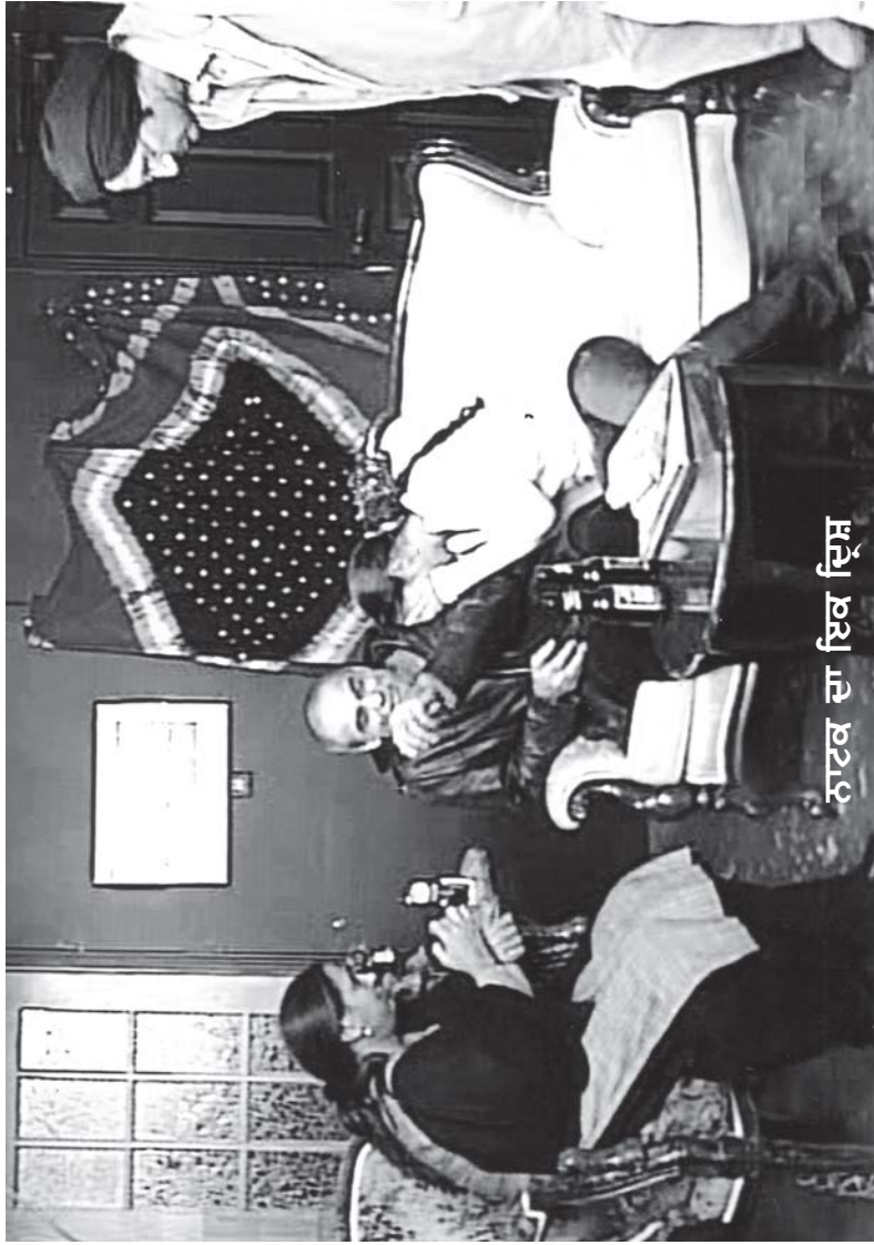
ਨਾਟਕ ਦਾ ਇਕ ਦ੍ਰਿਸ਼